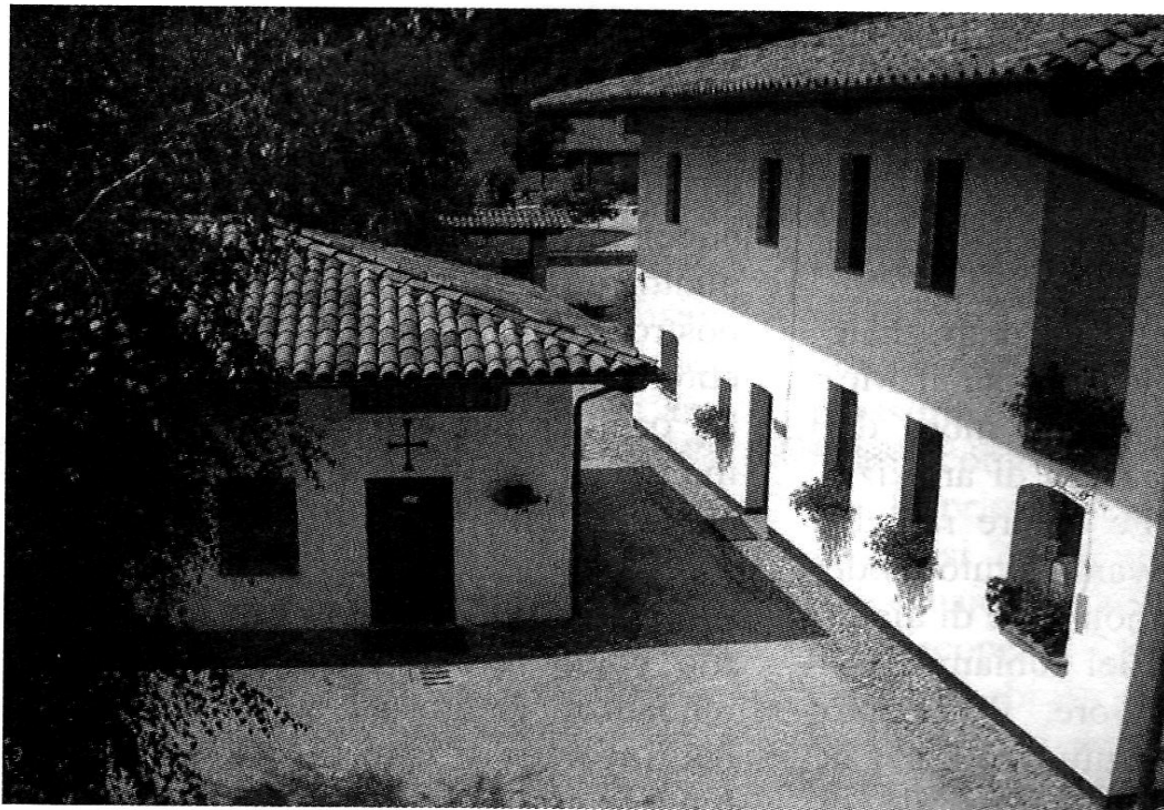
Il cortile interno della parte più antica del monastero con, a sinistra, la prima cappella ora destinata alla preghiera personale

eccellenza, che diventa misura del rapporto con gli altri.