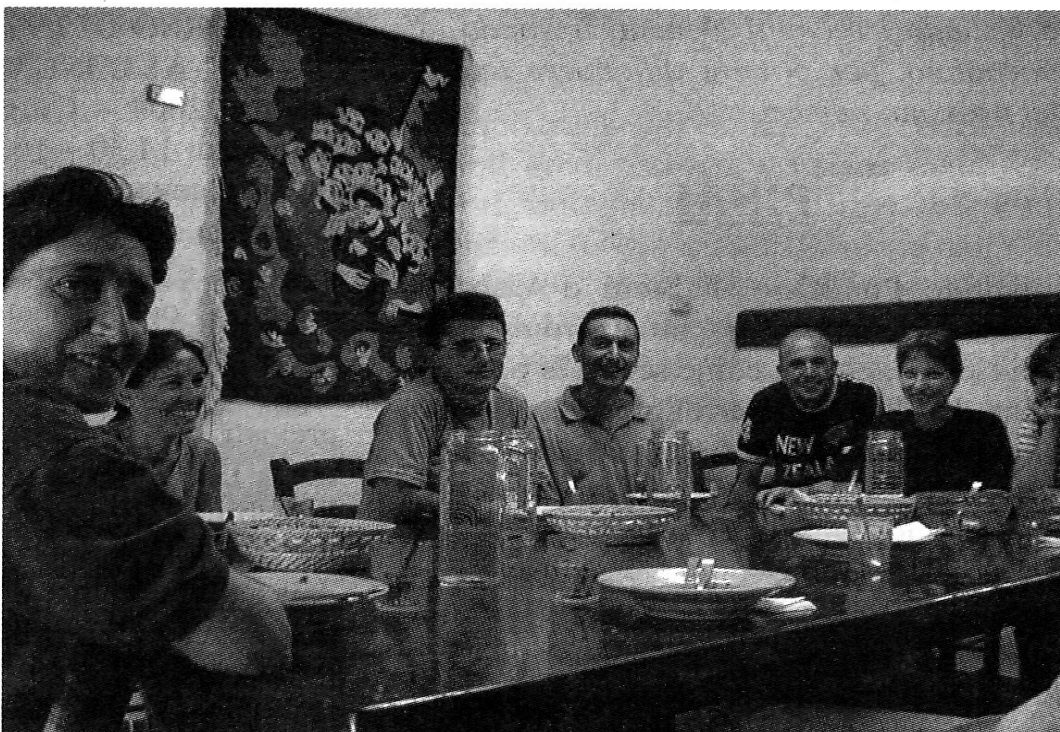
Un momento del pasto vissuto in unità e amicizia tra ospiti e membri della comunità